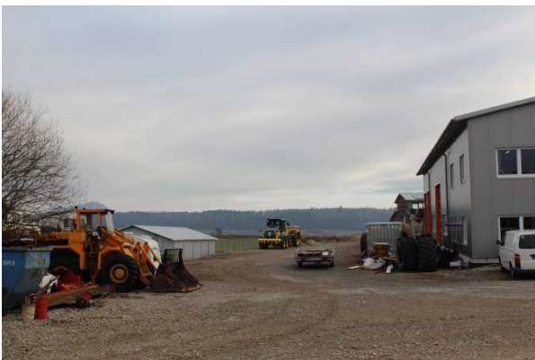
Blick von Westen über den nördlichen Teil des Geltungsbereichs. Der Versiegelungsgrad ist teilweise sehr hoch.