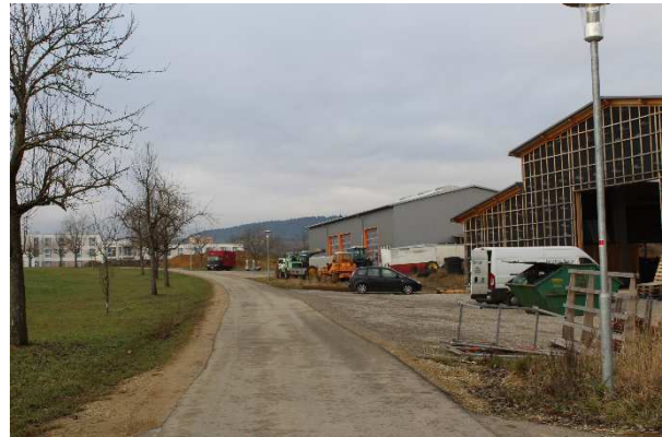
Blick entlang des Sandwegs nach Westen. Rechts zu sehen ist die gewerbliche Bebauung des Geltungsbereichs.