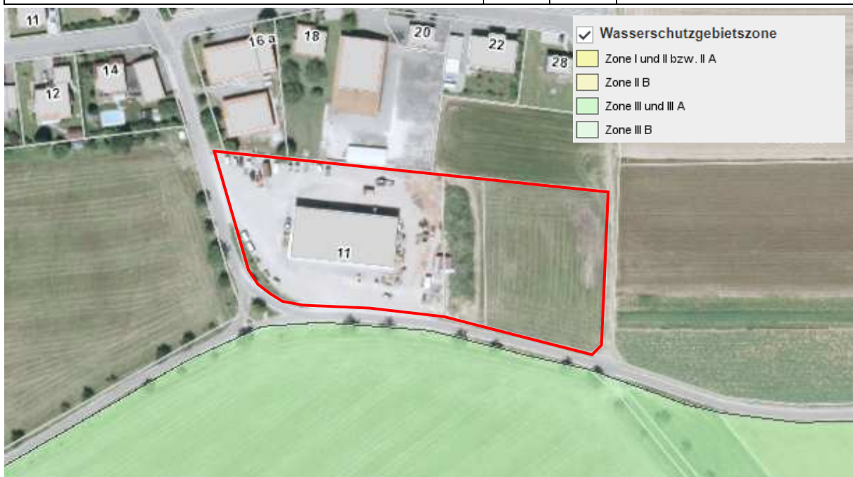
Abbildung 3: Schutzgebiete im Umfeld des GE Kalkgrube III (Rote Umrandung); unmaßstäblich