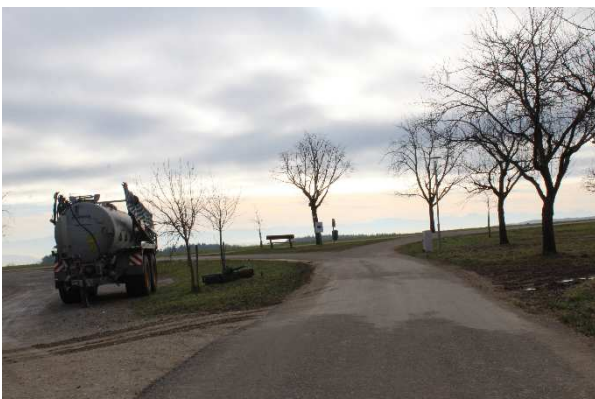
Blick vom westlichen Rand des Geltungsbereichs nach Süden. In einer Verkehrsinsel befindet sich eine Bank mit Aussicht über den Hegau und Alpenpanorama.