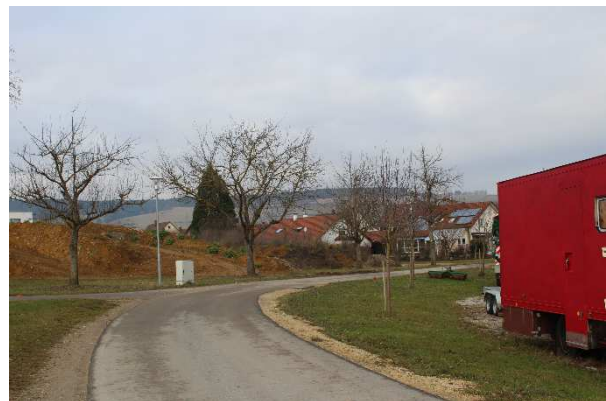
Im Südwesten des Plangebietes am Sandweg befindet sich eine kleine Grünfläche in der drei Bäume gepflanzt wurden (im Bild: rechts des Weges).