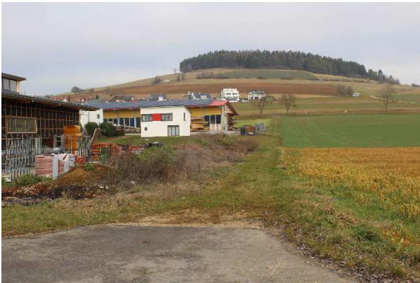
Blick von Süden entlang dem östlichen Rand des Geltungsbereichs in Richtung Wannenberg. Hier ist die gebietsinterne Pflanzung einer Feldhecke noch umzusetzen.