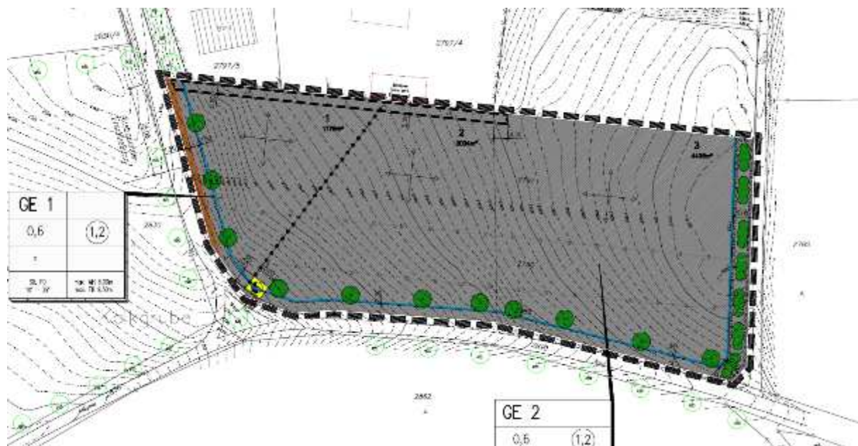
Abbildung 2: Auszug aus dem rechtsgültigen Bebauungsplan von 2012 mit Lage der verorteten Baumpflanzungen und der Feldhecke im Osten. Weitere 5 Bäume sind nicht fest auf den Baugrundstücken verortet.

Die Ermittlung des Eingriffs erfolgte nach dem damaligen Bewertungsmodell in Ökopunkten ÖP (Pflanzen/Biotope) und in Hektarwerteinheiten haWE (Boden). Aufgrund der damaligen Bewertung des Schutzgutes Boden in haWE erfolgt in der vorliegenden Umweltanalyse eine Neubilanzierung in Ökopunkten. Da der Bestandsplan des Umweltberichtes und die im Bericht enthaltene Bilanzierung geringfügige Diskrepanzen in den Flächenzuordnungen aufweisen, erfolgt auch für das Schutzgut Pflanzen/Biotope eine Neubilanzierung, der der Bestandsplan zugrunde gelegt wird. Das Eingriffsdefizit wurde 2012 mit 110.150 ÖP aus der Maßnahme „Öffnung Steinbach“ bei Blumberg ausgeglichen.