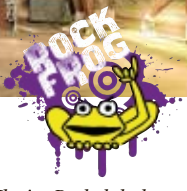
Am Samstag ab 20.30 Uhr heißt es im Festzelt „Dirndl rockt die Lederhose“ mit der Froschenkapelle aus Radolfzell. Der Vorverkauf ist abgeschlossen, ausreichend Karten gibt es ab 14.00 Uhr an der Hauptkasse im Festzelt und an der Abendkasse ab 18.00 Uhr im Probelokal.