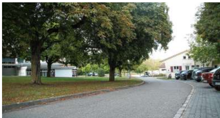
An dieser Stelle befinden sich während des Schätzele-Marktes noch die Stände verschiedener Vereine. Ab dem nächsten Jahr wird es dort wegen des neuen Ärztehauses bauliche Veränderungen geben. Zur Orientierung: Links auf diesem Bild befindet sich das Rathaus. Rechts ist das Vereinsheim des Deutschen Roten Kreuzes. Und wenn man die Straße entlanggeht, geht man direkt auf den Volksfestplatz zu.

So ein Projekt gibt es in Süddeutschland nur einmal. Und zwar in Tengen. Schon alleine das müsste Grund genug sein, dass sich Ärzte überlegen, sich im Hegau niederzulassen. Und wenn die jungen Ärzte dann Ende Oktober aus der Praxis treten, stehen sie gleich im Zentrum des Schätzele-Marktes.