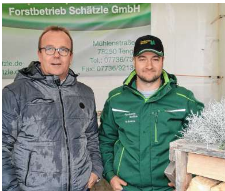
Der Forstbetrieb Schätzle informiert an der Gewerbeausstellung über seine verschiedenen Dienstleistungen.

Die Firma Stihl bietet Forst- und Gartengeräte für gewerblich und privat an. Der Heckenschnitt muss nicht mühsam sein. Voraussetzung dafür ist eine bedienungsfreundliche Ausstattung. Besonders praktisch sind akkubetriebene Heckenscheren beispielsweise von Stihl. Sie sind schnittstark, leise und kabellos, sodass der Freizeitgärtner nicht in seinem Bewegungsradius eingeschränkt wird. Benno Weber Land- und Agrartechnik ist dieses Jahr als Vertretung der Firma Stihl auf dem Schätzle-Markt präsent und weist darauf hin, dass jetzt auch Rasenmäherroboter auf dem Markt begutachtet werden können.