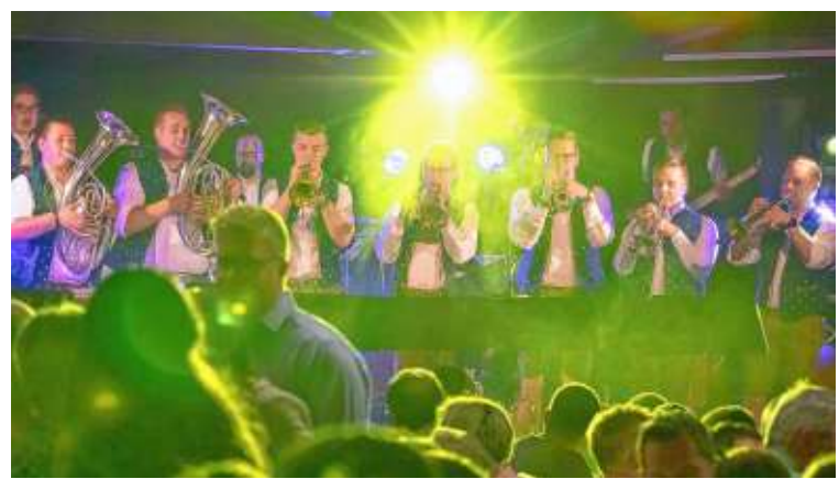
Am Montag Abend ab 20.00 Uhr startet der große Bierabend mit Abschlussparty: Für Stimmung sorgen die Baaremer Luusbuübä .