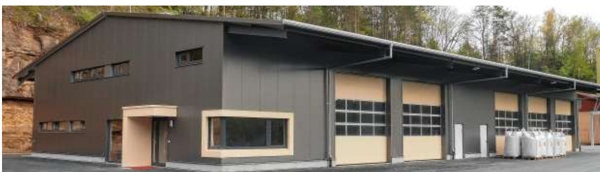
Jetzt steht es, das neue Bauhofgebäude. Verschiedene Werkstätten ermöglichen viele Reparaturen direkt vor Ort. Die Lagerungsmöglichkeiten für Material und Schüttgut sind besser. Die Stromkästen und Straßenschilder für den Schätzele-Markt können jetzt mit dem Gabelstapler aus den Hochregalen gehoben werden und anschließend durch eines der fünf Sektionaltore an ihren Bestimmungsort gebracht werden.

Der Werkstattbereich ist großzügig ausgestattet. Außerdem ist die Halle beheizbar. Im Bauhof gibt es eine neu geschaffene Schreinerei. Durch verschiedene Werkstätten sind viele Reparaturen nun direkt vor Ort möglich. Es gibt im neuen Bauhof bessere Lagerungsmöglichkeiten für Material und Schüttgut. Für die Mitarbeiter stehen ansprechende Sozialräume zur Verfügung. Die Küche ist großzügig und hell. In die Mauern im Außengelände wurden auch Sandsteine und Ornamente verbaut, die noch vom alten Rathaus stammen. Die neue Halle ist 1100 Quadratmeter groß mit Baukosten von 1,9 Mill. Euro.