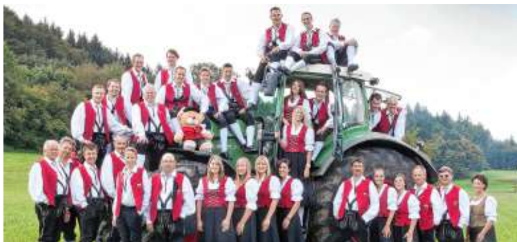
Am Sonntag Abend vor dem großen Feuerwerk ab 18.30 Uhr beginnt das Unterhaltungskonzert mit dem Musikverein Zoznegg .