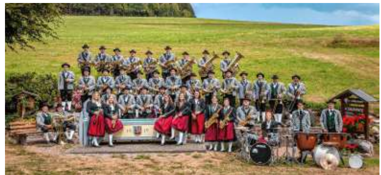
Das beschwingte Sonntags-Unterhaltungsprogramm im Festzelt startet am Sonntag Vormittag um 11.00 Uhr mit der Trachtenkapelle Dachsberg .