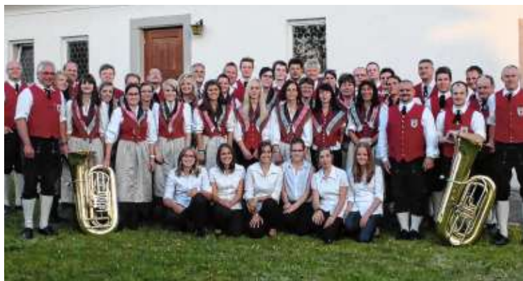
Am Sonntag Nachmittag ab 13.30 Uhr sorgt der Musikverein Rast mit seinem Unterhaltungskonzert für beschwingte Laune.