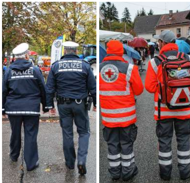
Die Polizei und das DRK sind am Schätzele-Markt für die Besucher im Einsatz.

Die Kindersammelstelle beim DRK-Heim neben dem Rathaus ist ausgeschildert. Im DRK-Heim befindet sich außerdem noch ein Wickel- und Stillraum.