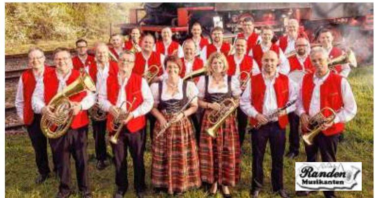
Am Montag ab 14.30 Uhr haben die Randenmusikanten mit Volldampf böhmisch-mährisch ihren schwungvollen Auftritt beim Unterhaltungsnachmittag.