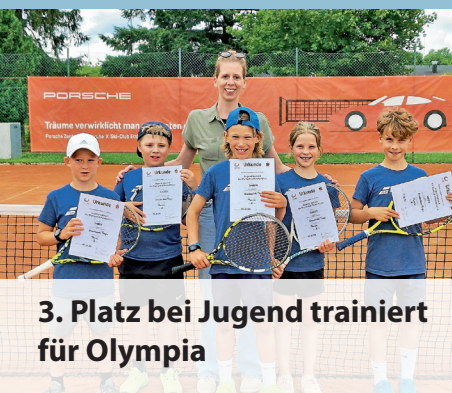
3. Platz bei Jugend trainiert für Olympia