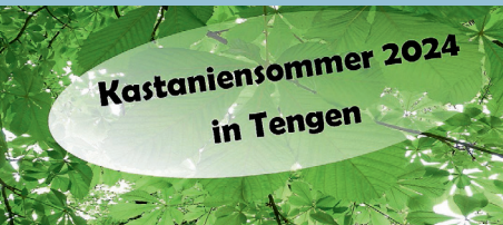
Unsere Veranstaltungen unter den Kastanien beim Rathaus in Tengen

Sa. 13. Juli 2024 18:00 Uhr Musikalische Sommernacht mit den Dörflemusikanten - Blasmusik aus dem Hegau - Veranstalter: Forderverein NV Kamelia Tengen