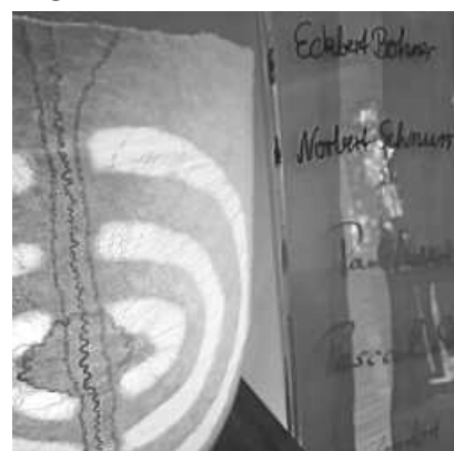
Gedenk-Stele in der Klinikkapelle in Singen

In den Novembertagen laden wir ein, den Erinnerungen an unsere lieben Verstorbenen Raum zu geben. In der Klinikkapelle kann der Name des Verstorbenen auf die Gedenk-Stele „Eingewoben im Geheimnis der Liebe“ geschrieben werden.