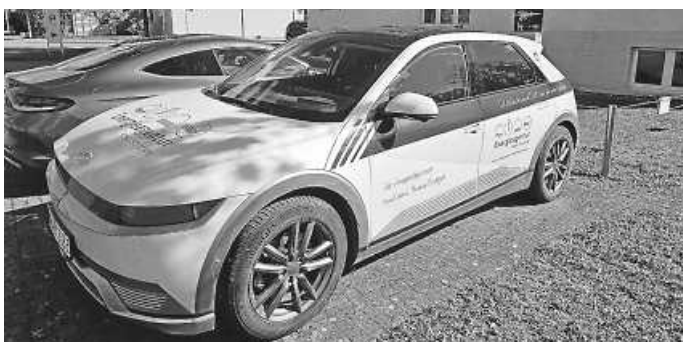
Das E-Fahrzeug der Energieagentur Kreis Konstanz beim Laden am Arbeitsplatz