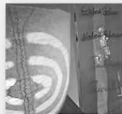
Gedenk-Stele in der Kapelle

Die 24h Rufbereitschaft ist über die Anmeldung und die Stationen erreichbar. Alle Gottesdienste werden über Kanal 24 in die Krankenzimmer übertragen. Infos: www.klinikseelsorge-singen.de und #klinikseelsorgesingen