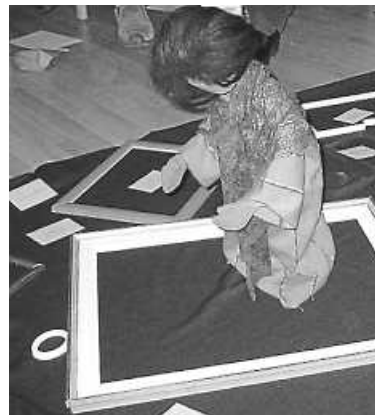
Stufen des Lebens