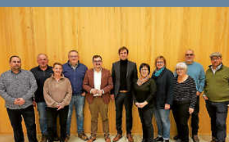
Landrat Zeno Danner besuchte Tengen