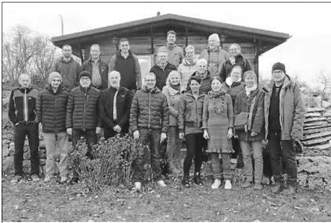
21 Teilnehmerinnen und Teilnehmer haben die Ausbildung zum LOGL-geprüften Obst- und Gartenfachwart am Landwirtschaftsamt Stockach erfolgreich abgeschlossen.