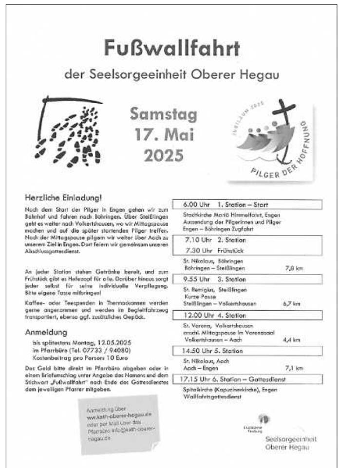
Plakat: SE OH