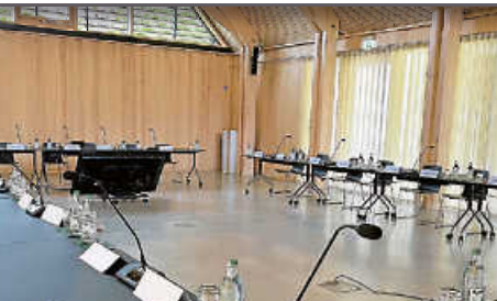
Gemeinderatssitzung am 17.10.2024