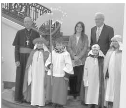
Sternsinger Stuttgart