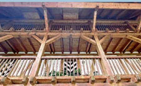
NEWS von Schloss Blumenfeld