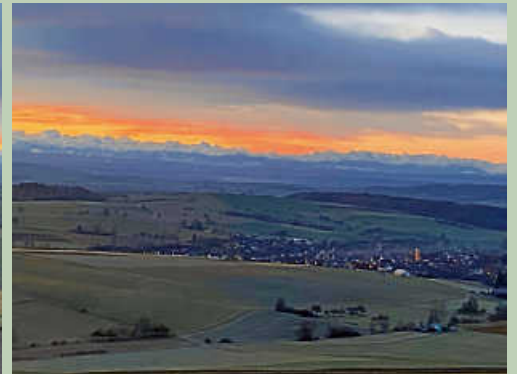
Alpenpanorama vom „Alten Postweg“

Warm angezogen können besonders im Winter beeindruckende Ausblicke von unseren Premiumwanderwegen „Alter Postweg“ oder auf der „Wannenbergtour“ genossen werden.