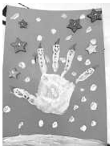
Bastelaktion an der Grundschule

Auch dieses Jahr konnten wir mit den Klassen 2 und 3 basteln. Alle waren mit viel Spaß dabei. Das Jahr 2023 neigt sich dem Ende entgegen. Ohne die Unterstützung und Hilfe vieler Menschen und Unternehmen aus Tengen wäre die Durchführung mancher Veranstaltung für die Schülerinnen und Schüler durch den Förderverein nicht möglich gewesen. Wir können 2023 auf viele Aktionen und Veranstaltungen zurückblicken. Den Jahresausklang 2023 nehmen wir jetzt zum Anlass, um Danke zu sagen.