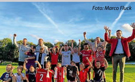
Neue Trikots für die E-Jugend