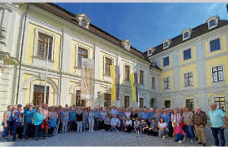
Rückblick auf die Seniorenfahrt 2023