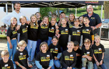
GrillNinjas für die Kinderpostkartenaktion