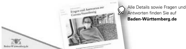
Alle Details sowie Fragen und Antworten finden Sie auf Baden-Württemberg.de

Schulen bei Inzidenz über 100 im Wechselunterricht. Bei Inzidenz über 165 sind Schulen im Fernunterricht. Kitas schließen. Notbetreuung möglich. Diese beiden Regelungen gelten auch für außerschulische Bildungseinrichtungen.