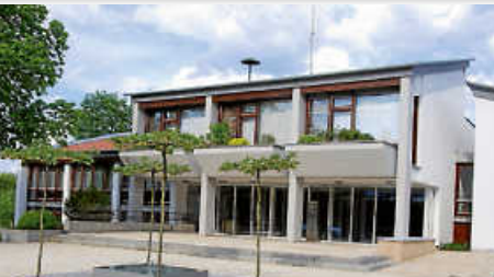
Rathaus am 10.10.2023 ab 10 Uhr geschlossen